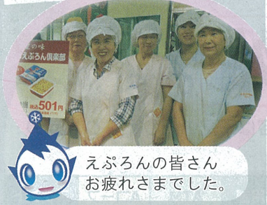
えぶろんの皆さんお疲れさまでした。