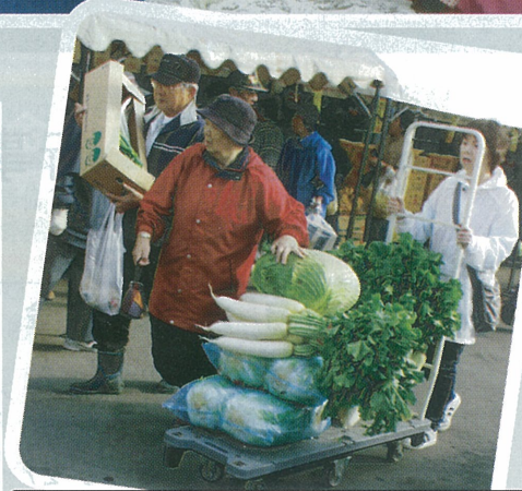
▲10/27 Aコープ本店漬物市 たくさんのお買い上げありがとうございます。