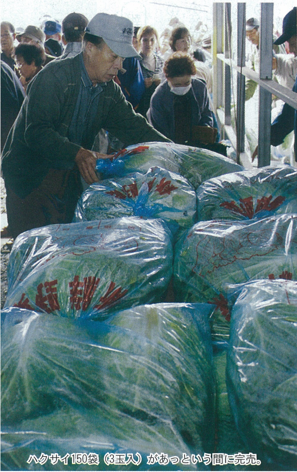
ハクサイ150袋(3玉入)があっという間に完売。

この日、特設会場となった同JA本所の駐車場には開場前からお目当ての野菜に並ぶ買い物が客が大勢詰めかけた。会場にはハクサイやダイコンをはじめ漬物用のみそ、みりん、本身欠きにしんやプラスチック製の漬物樽などがずらりと並んだ。 ハクサイは3玉入り袋、ダイコンは10本束、タマネギは10kgのネット袋でまとめ売りする漬物市ならではの風景。主役のハクサイとダイコンは、売り出して早々に売り切れた。酒粕や甘こうじも箱で買い求める客が多かった。 買い物客の中には一輪車や台車で大量の荷物を積み込み、売場と車を何度も往復する姿もあり、漬物用品でトラックや後部座席が満杯の車も見られた。