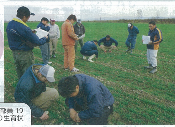
▶11/1 青年部第4回営農学習会を行い部員19人が参加。部員の秋播き小麦圃場を回り生育状況と今後の栽培管理を学びました。