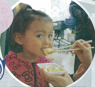
▲10/26 コア誕生祭で青年部・女性部の役員がおもちつきを手伝いました。