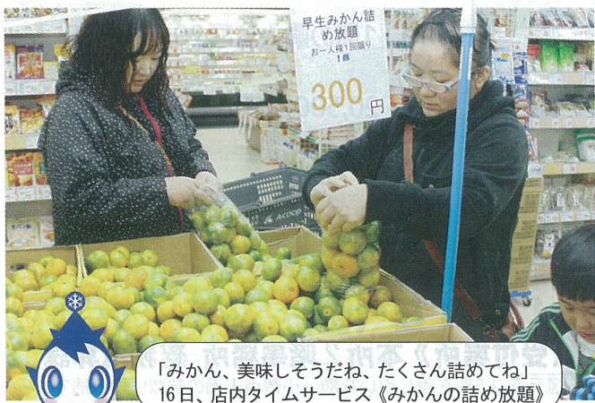
「みかん、美味しそうだね、たくさん詰めてね」 16日、店内タイムサービス《みかんの詰め放題》