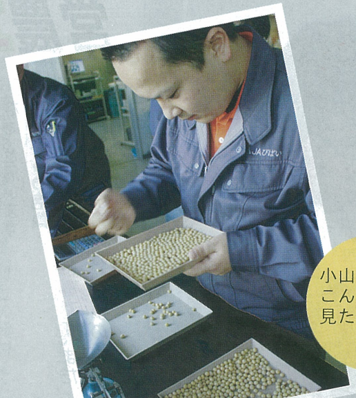
小山くんの こんな顔つき 見たことない (ポツ)