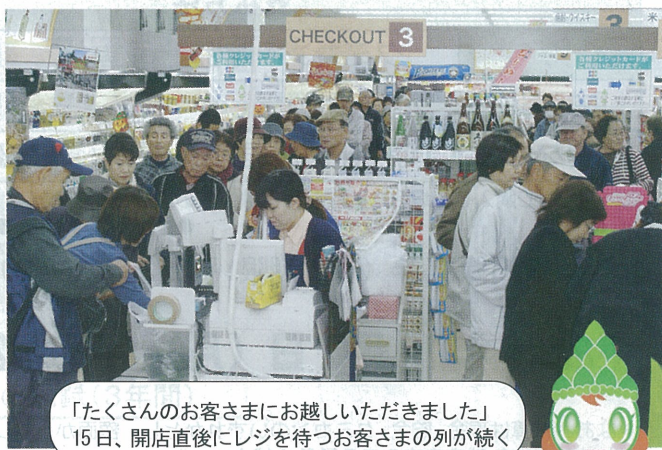
「たくさんのお客さまにお越しいただきました」 15日、開店直後にレジを待つお客さまの列が続く