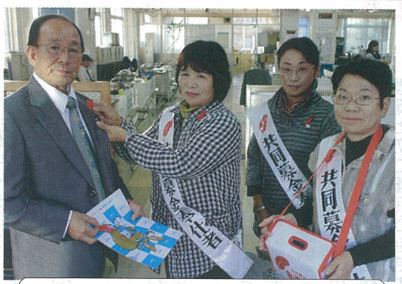
▲10/3 J A 女性部三役が 赤い羽根共同募金運動に協力 (J A 本所)