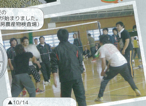
▲10/14 青年部南部ブロック 親睦スポーツ大会 部員 11 人が参加 (栗沢 B & G 海洋センター)