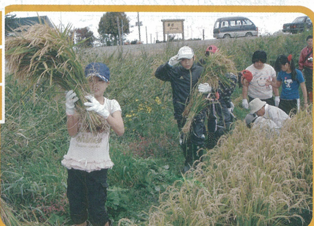
9/26 ■中央小学校の 5 年生 74 人が参加 (沼の内・桑折長治氏圃場にて)