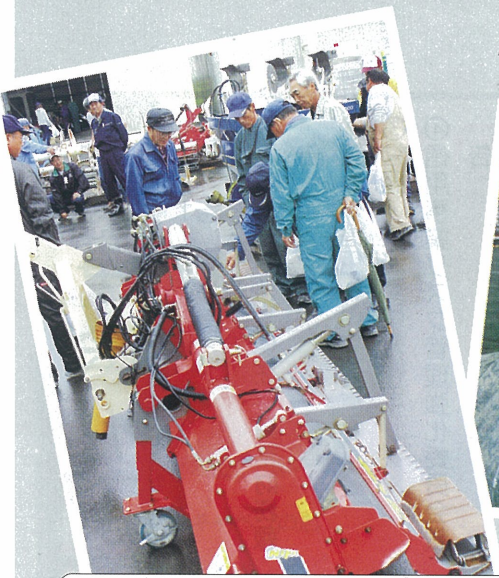
▲6/19 遊休農機具展示即売会。119点が出品されうち59点が即売されました。(らいす工房)