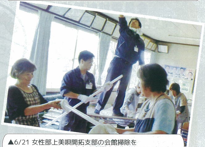
▲6/21 女性部上美倶楽部支部の会館掃除をJAの出向く事業班もお手伝いしました。