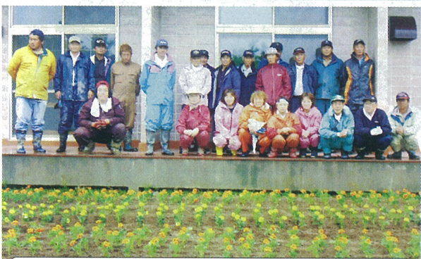
▲6/18 茶志内3連合会は地域の3カ所にマリーゴールドの苗を植えました。(茶志内3区会館でパジャ)