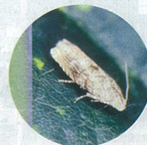
《マメシクイガ成虫》