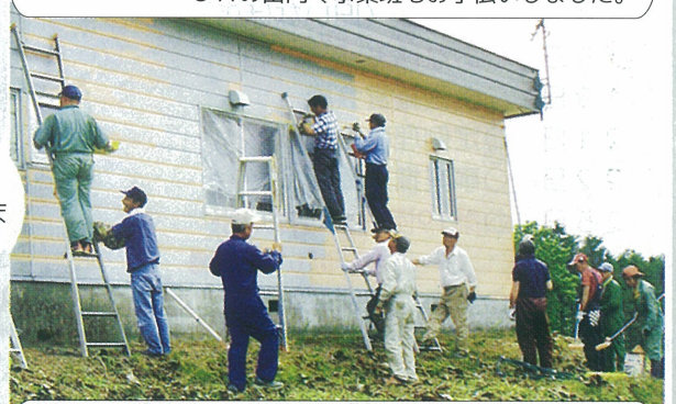
▲6/28 北美倶連合会は北美倶楽部農改善センターのお色直しを会員の協力で行いました。

モナ・カサンドラ【プロフィール】 占いを学術的に解析する「ルネ・ヴァン・ダール研究所」の研究生となり、占星学のロジックを徹底的に解説・探究。コンピュータによるホロスコープ作成の道を開いた。現在は執筆活動を始め、さらなる占星の研究を重ねている。 ルネ・ヴァン・ダール研究所 http://www.rene-v.com/