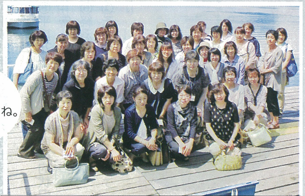
▲7/9 女性部の一日本員研修に37人が参加。苫小牧の三星の工場を見学しました。(支笏湖にて)