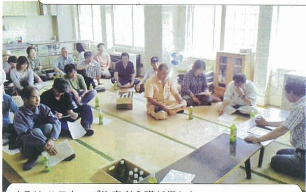
▲7/1 ハスカップ生産者会議が行われ、19人が出席しました。(選果場2階)