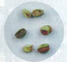
《マメシクイガによる被害》