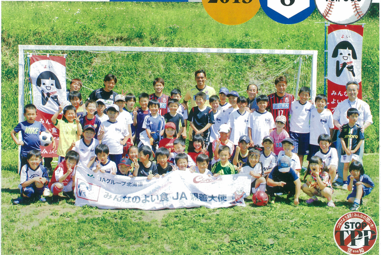
6月23日 2013 みんなのよい食JA親善大使開催 (サン・スポーツランド美唄)