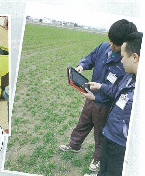
▲4/26 秋まき小麦の雪腐病調査で タブレット端末が大活躍！