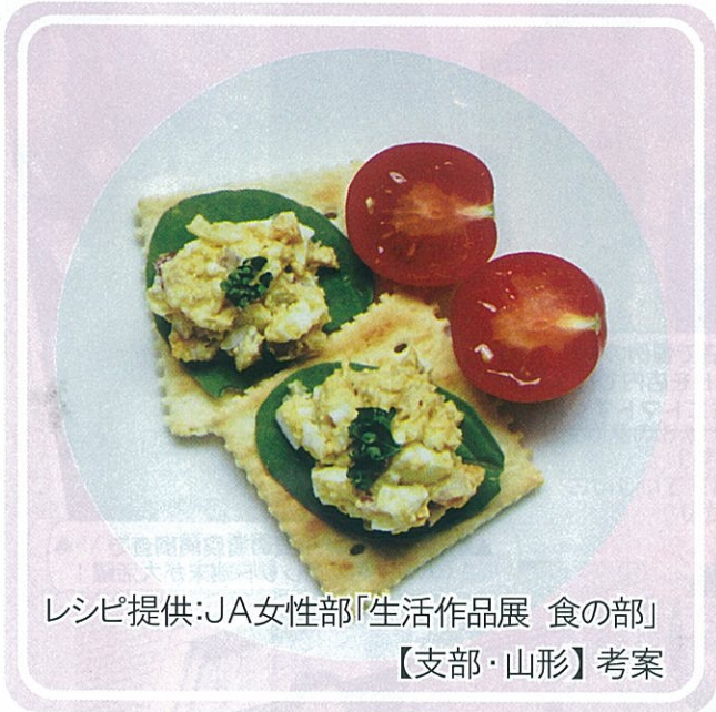
レシピ提供:JA女性部「生活作品展 食の部」 【支部・山形】考案