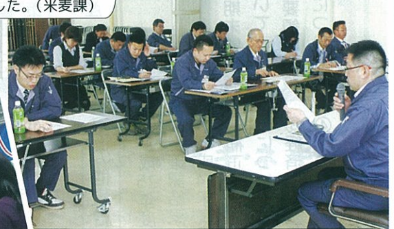
▲4/22 営農に携わる部署の職員を対象にした 第1回目の営農講習会を開催しました。

美唄産のお米「おぼろづき」、 「グリーンアスパラ」 おいしいですよ。 いかがですかあ。