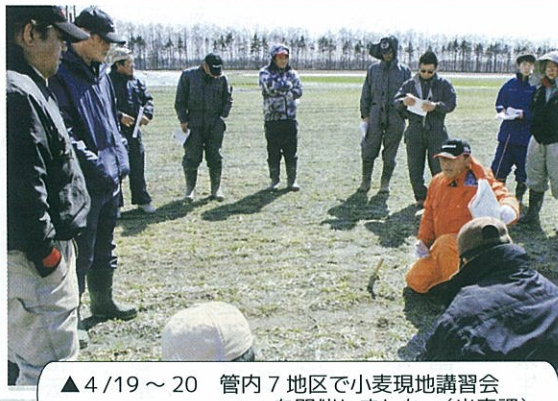
▲4/19～20 管内7地区で小麦現地講習会 を開催しました。(米麦課)

美唄産のお米「おぼろづき」、 「グリーンアスパラ」 おいしいですよ。 いかがですかあ。