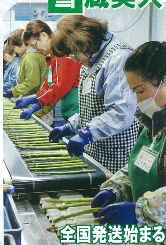
アスパラを丁寧に選果するパートタイマー

JAは、この時期に収穫・出荷されるアスパラを「雪解けアスパラ」と呼び「みずみずしさと甘み」をセールスポイントにしている。また、雪の冷熱を活用した雪室方式で予冷した高鮮度・高品質なアスパラをJAオリジナルブランド「雪蔵美人」として札幌や全国に届けている。