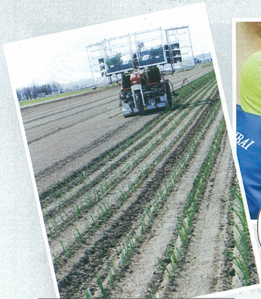
▲4/29 タマネギの移植作業始まる