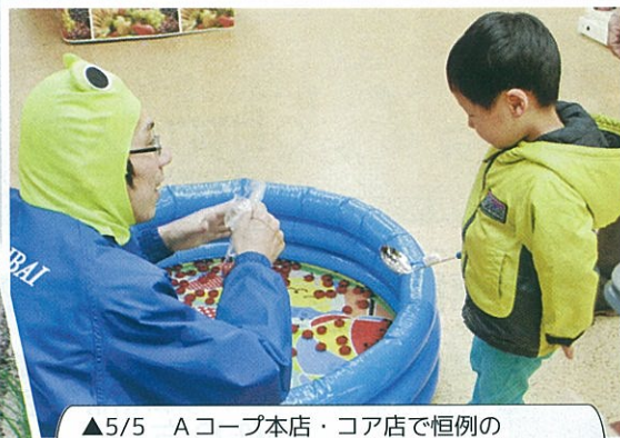
▲5/5 Aコープ本店・コア店で恒例の こどもの日のイベントを店内で行った。 (コア店：ミニトマトすくい)