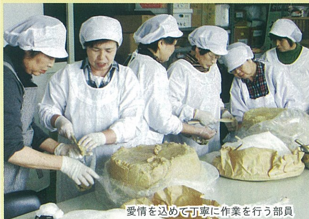
愛情を込めて丁寧に作業を行う部員

作業をした部員は「ひと手間かけることで、より美味しい味噌が出来上がります。今年も仕上がりが楽しみです」と笑顔で話した。