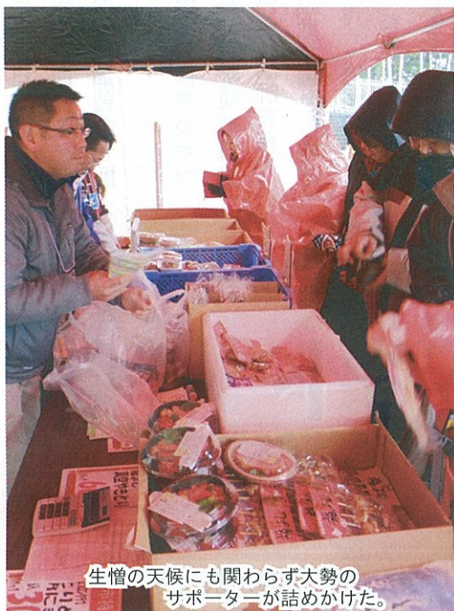
生憎の天候にも関わらず大勢のサポーターが詰めかけた。

「雪蔵工房おぼろ」とグリーンアスパラガス「雪蔵美人」を販売。併せて地元特産の「中村のとりめし」「美唄やきとり」米粉を使ったシフォンケーキなども販売し、とりめしとケーキは完売するほど人気だった。