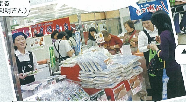
▲4/24～30 そごう横浜店「初夏の北海道物 産展」で雪蔵工房おぼろづき、雪蔵美人アス パラ等をPR販売しました。